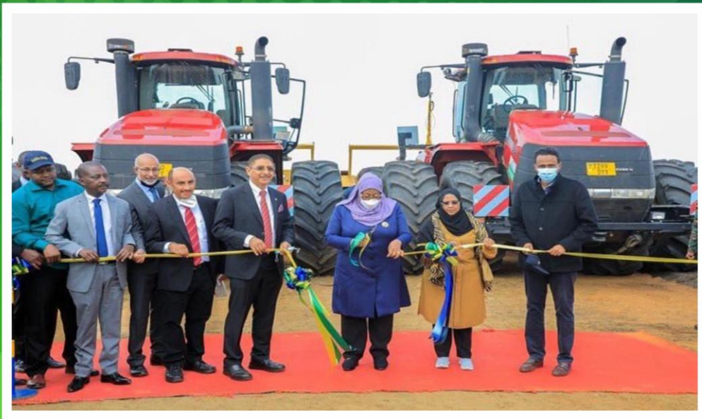
Wizara ya Fedha na Mipango Mji wa Serikali - Mtaa wa Hazina Mtumba S.L.P 2802, 40468 Dodoma, Tanzania